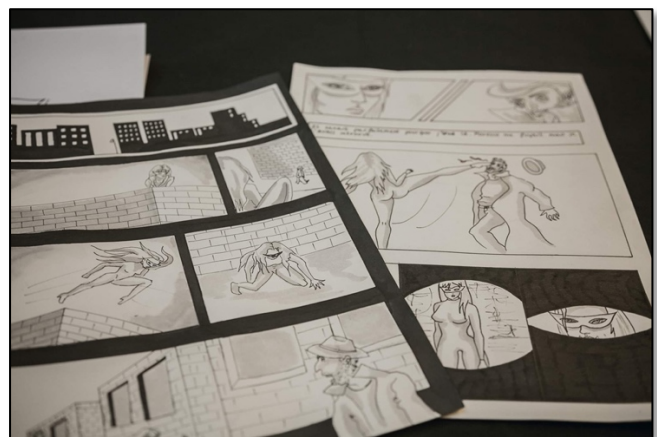
Images extraites d'un workshop à l'ECV de Lille.